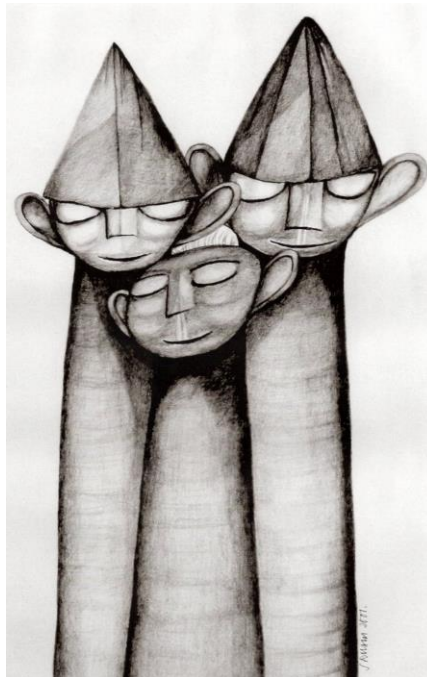
Rys. Stefan Rusin

Badania wykazują, iż niezależnie od stopnia prorynkowego nastawienia gospodarki w krajach europejskich, podstawowe znaczenie dla rozwoju kultury tych krajów mają środki publiczne pochodzące z budżetu państwa i budżetów samorządowych. Czy pamięta się o tym w Polsce?