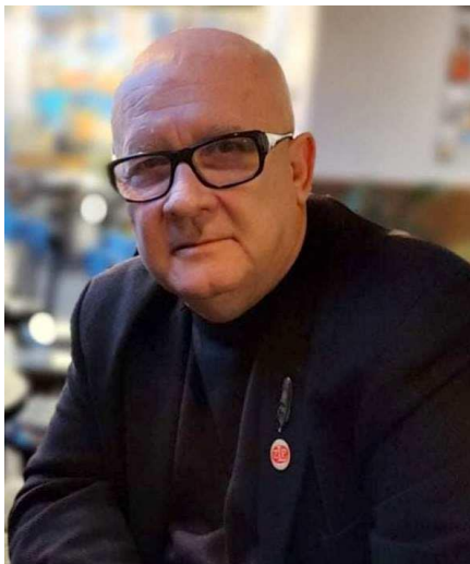
Fot. Andrzej Walter