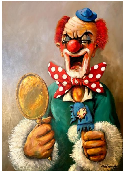
Rys. Sławomir Łuczyński

Bardzo często zdarza się, że człowiek przestaje się złościć, a zaczyna się śmiać. I to nie jest śmiech zdrowy, tylko taki, który pojawia się wtedy, gdy coś, co miało być poważne, zamienia się w karykaturę samego siebie. Ostatnia inscenizacja „Potopu” w Teatrze Telewizji jest właśnie takim momentem – spektaklem, który nie tyle reinterpretował Sienkiewicza, ile zrobił z niego widowisko przypominające imprezę tematyczną, na której nikt już nie pamięta, po co właściwie się spotkano. Bo jeśli ktoś jeszcze ludzi się, że Teatr Telewizji jest miejscem, gdzie klasyka traktowana jest z jakimkolwiek respektem, to teraz powinien już porzucić te złudzenia raz na zawsze. Oto bowiem dostaliśmy „Potop”, który nie jest ani „Potopem”, ani teatrem, ani nawet sensowną prowokacją. To raczej zlepek pomysłów, które ktoś wrzucił do jednego worka, potrząsnął i wysypał na scenę, licząc, że chaos zostanie pomylony z odwagą artystyczną.