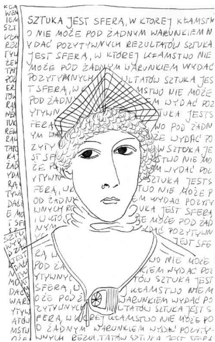
Rys. Barbara Medajska