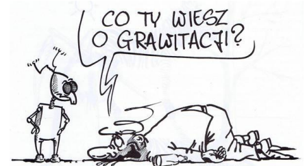
Rys. Sławomir Tuczyński

Zdjąłem ze ściany ostatni portret. Przytłumiona starością szarość ścian wypełniła pusty odgłos pokoju. Jeszcze tylko stare krzesło i dopalająca się żarówka. Nadarzyła się okazja do zmian, do niepokojącej przyszłości. Wolni i myślący, gorliwie wierzymy w nieznanne, niezbadane, niedoświadczalne. Tworzymy własne zasady nieomylności. Dajemy się zaciągnąć do złudnego pokoju zwierzeń. Wątpimy, że serce może bić po lewej stronie, a ufamy niekończącym się obietnicom lepszych kłamstw. Jeszcze tylko zanieść pełne pudła naiwności do archiwum zapomnienia.